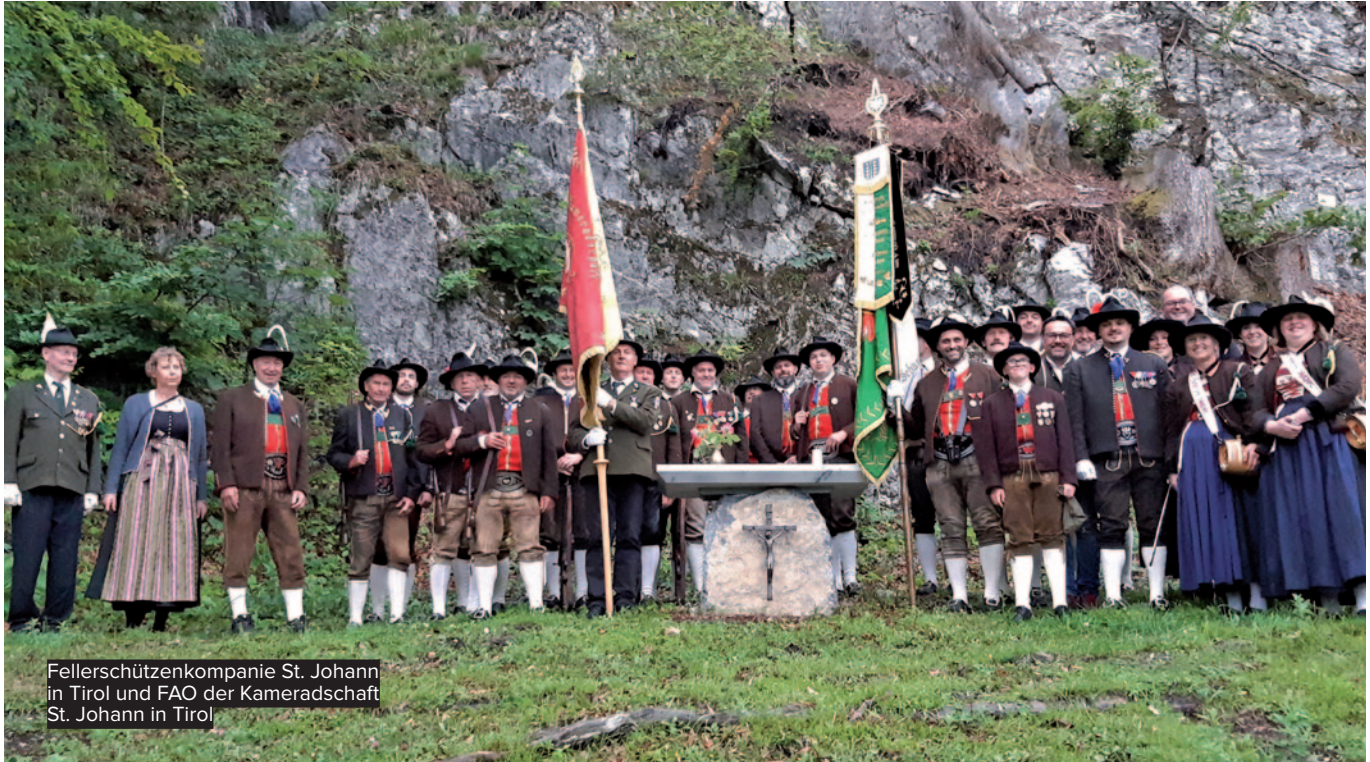
Fellerschützenkompanie St. Johann in Tirol und FAO der Kameradschaft St. Johann in Tirol

ERSTE AUSTRÜCKUNG DER FELLERSCHÜTZENKOMPANIE ST. JOHANN BEIM PATROZINIUM DER EINSIEDELEI. SPENDE EINER NEUEN ALTARPLATTE.